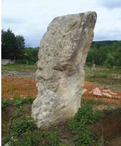
15. Menhir de Gaillonnet à Seraincourt.